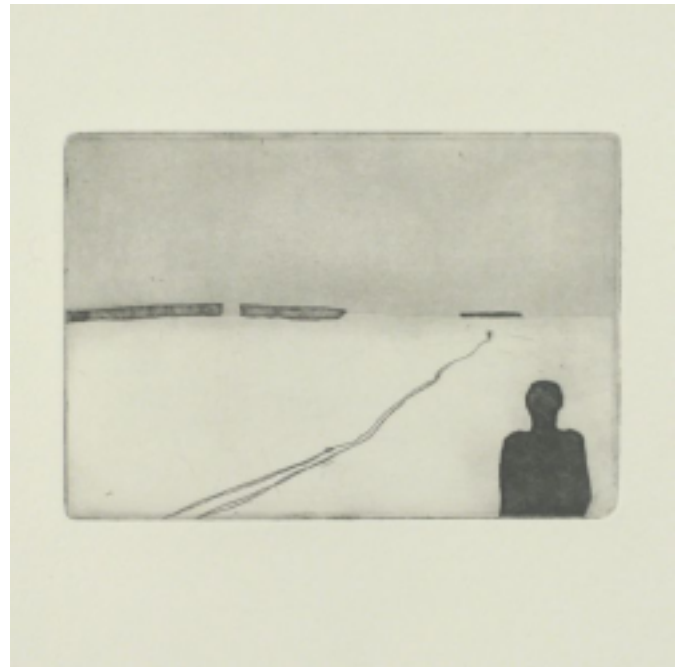
Lars Nordström koppartryck