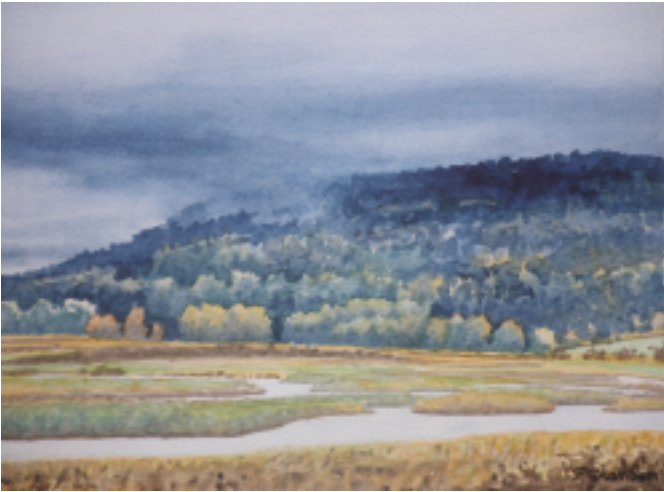
Tore Granbom akvarell