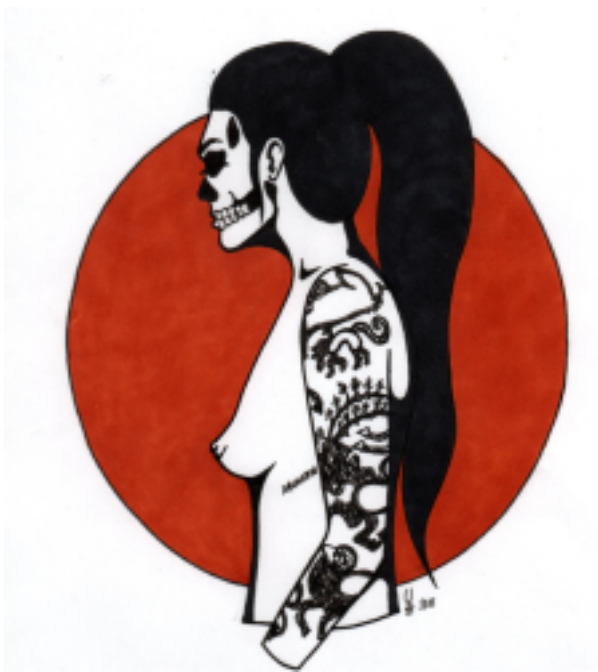
Ylva Svensson teckning, måleri