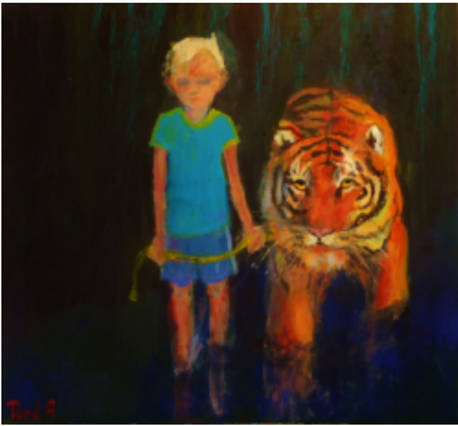
Tord Andersson måleri