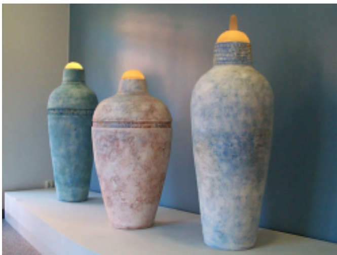
Sanna Öhlen keramik, bild