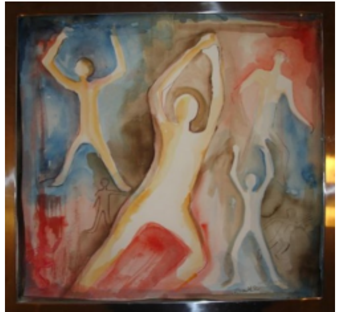
Barbro Skantze måleri