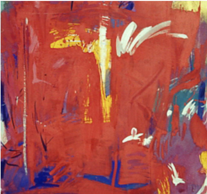
Göran Elisson måleri