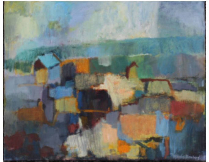
Hjördis Blomberg måleri