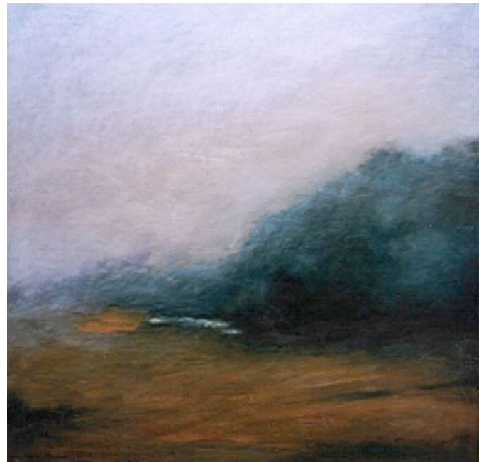
Ulla Holmstrand måleri