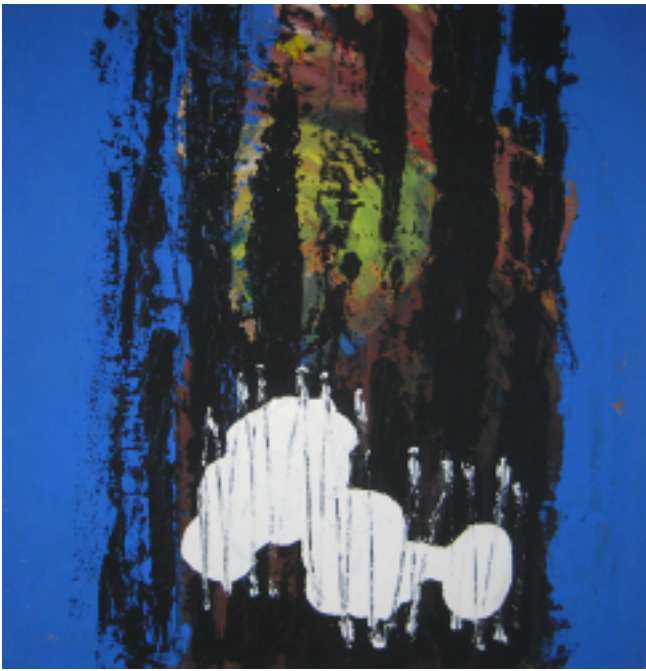
Nils Ekberg måleri