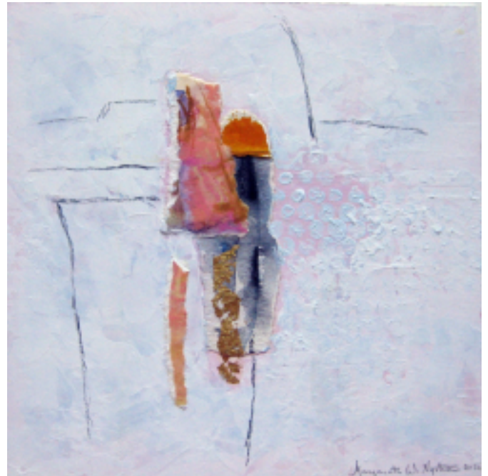
Margareta Nyström måleri, collage