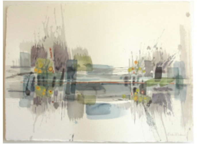
Kicki Rask måleri, design