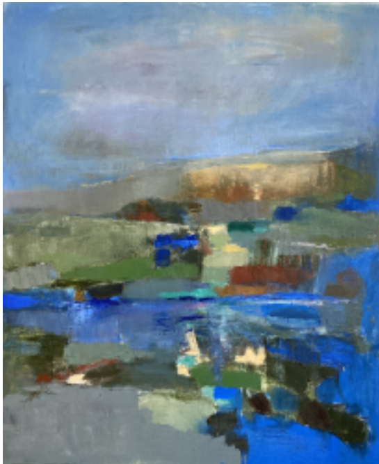
Ingan Linde måleri